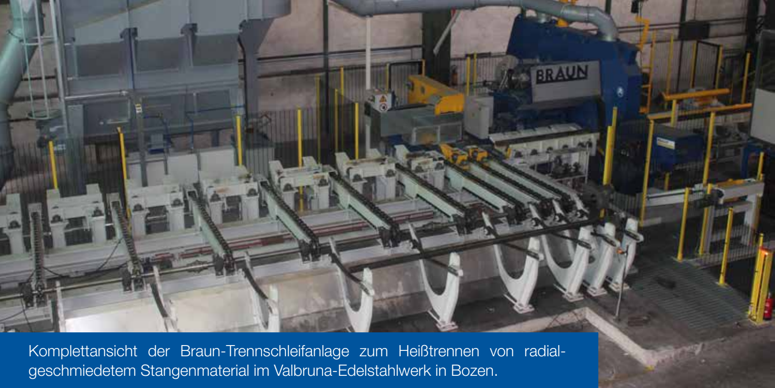
Komplettansicht der Braun-Trennschleifanlage zum Heißtrennen von radial-geschmiedetem Stangenmaterial im Valbruna-Edelstahlwerk in Bozen.

senkbaren Rollgang abgelegt. Die Anpressbewegung erfolgt mittels gleichlaufgesteuerter Hydraulikzylinder und der Antrieb der Förderrollen elektromechanisch. Letztere Antriebsaufgabe übernehmen zwei Watt-Kegelstirnradtriebmotoren des Typs K75 mit einer Motorleistung von 3 kW. Die Getriebemotoren in Schutzart IP55 laufen bei einer Untersetzung von i=51,02 mit einer Abtriebsdrehzahl von 28 U/min und erzeugen ein Drehmoment von 1012 Nm.